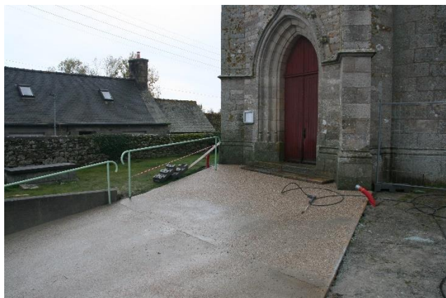
Parvis de l'église

Les travaux de rénovation du parvis de l'église sont achevés. Le but était de remplacer les pavés autobloquants usés et difficiles à entretenir. La verdure avait tendance à s'installer entre les pavés et rendait le nettoyage plus compliqué. L'ensemble a été rénové par un dallage en gravillon lavé. Les travaux ont été effectués par l'entreprise Jézéquel, de Pédernec, pour un coût de 6 700 €.