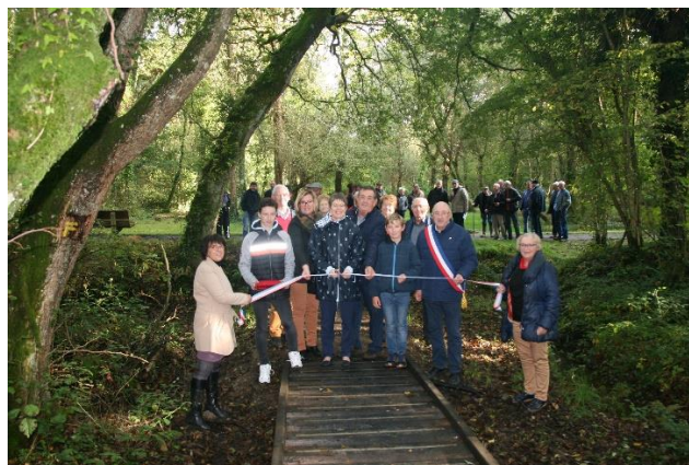
Passerelles du Champ de tir